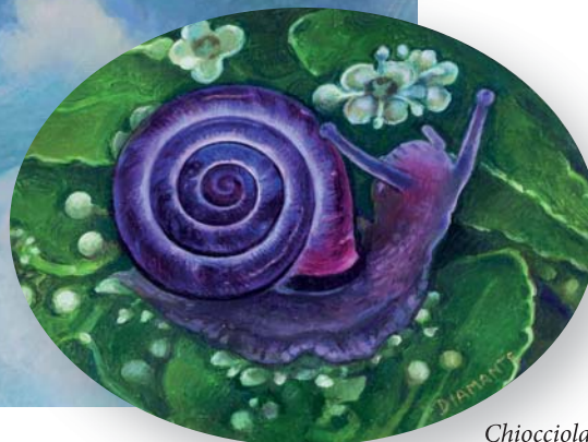
Chiocciola viola (olio su tela)