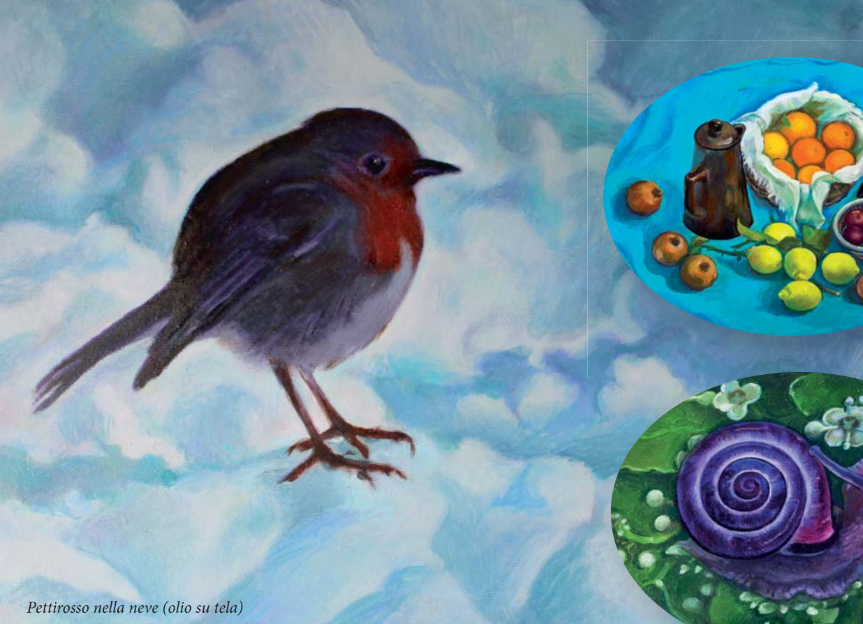
Pettiroso nella neve (olio su tela)