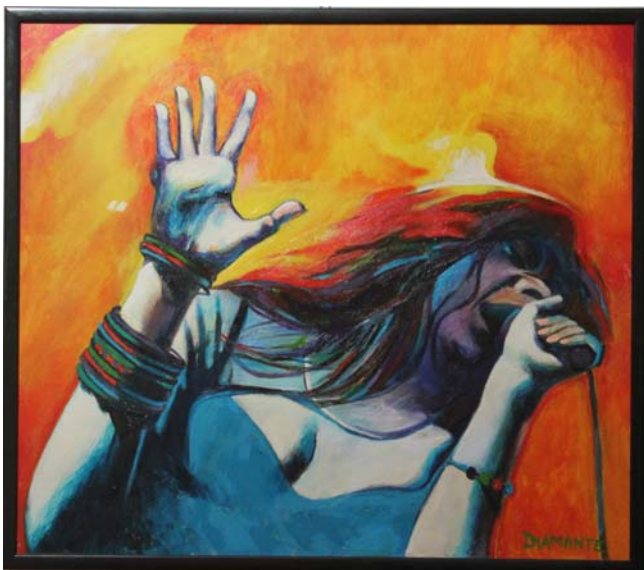
Napalm Janis (olio e acrilico su tela)