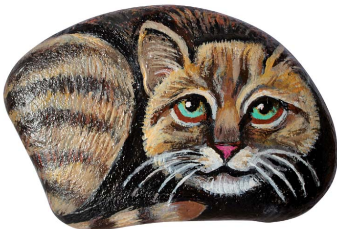
Micio tramazzottolo (acrilici su ciottolo)